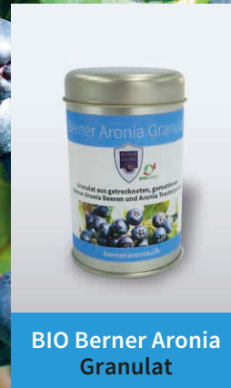
BIO Berner Aronia Granulat