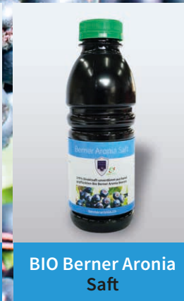
BIO Berner Aronia Saft