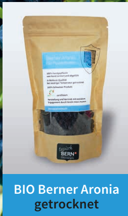
BIO Berner Aronia getrocknet